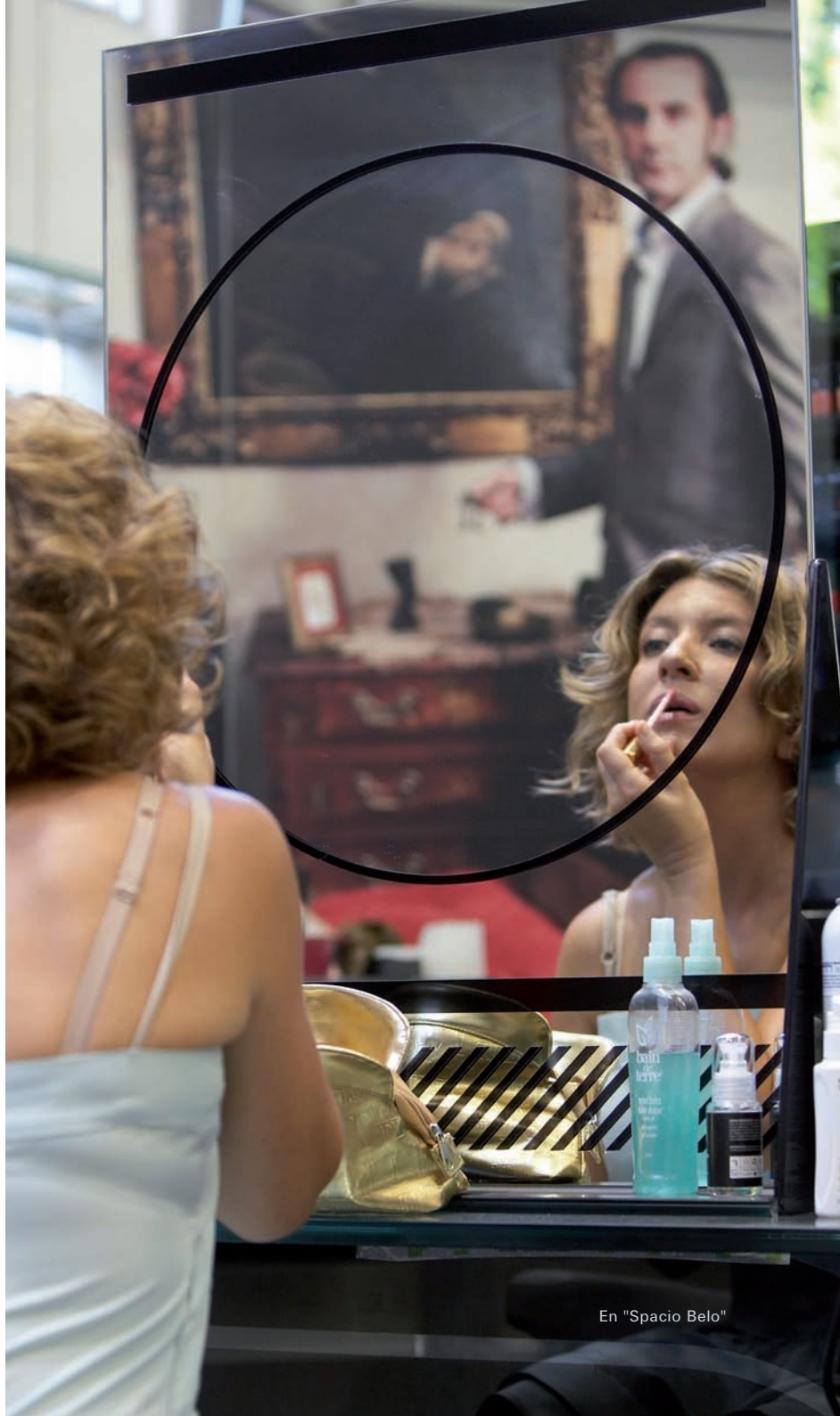
En "Spacio Belo"